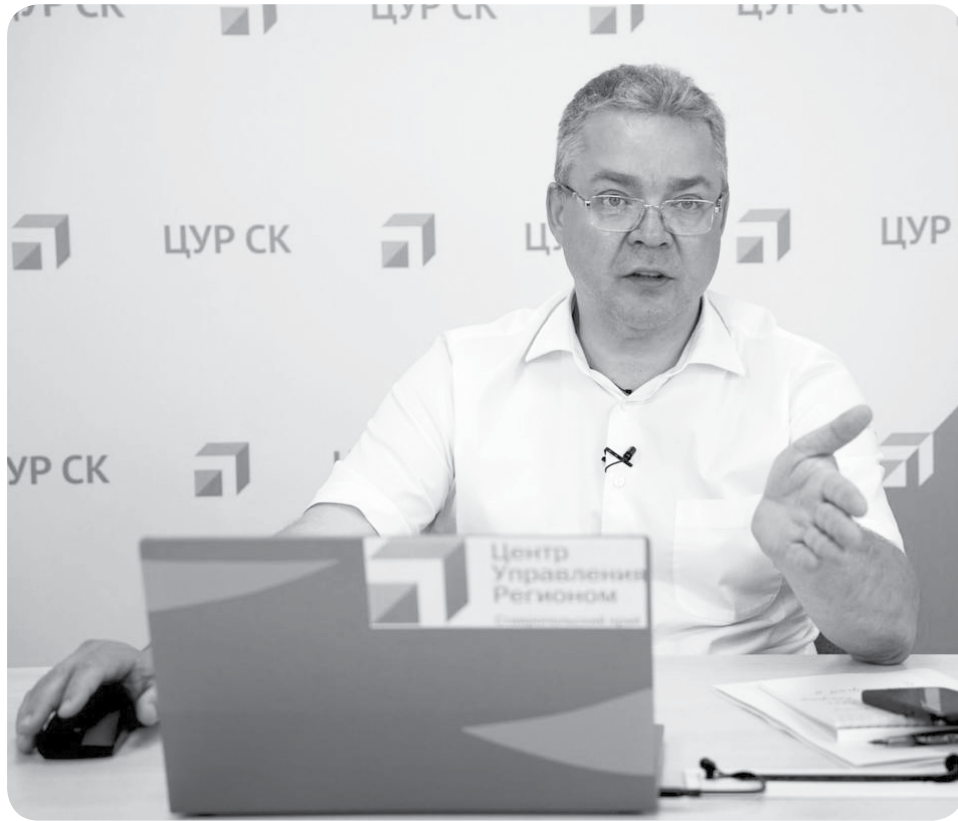
Владимир Владимиров поручил краевому минэнерго создать карту проблемных точек перебоев электроэнергии.

Отвечая на обращения, касающиеся вопроса энергоснабжения, глава региона поручил создать «те-